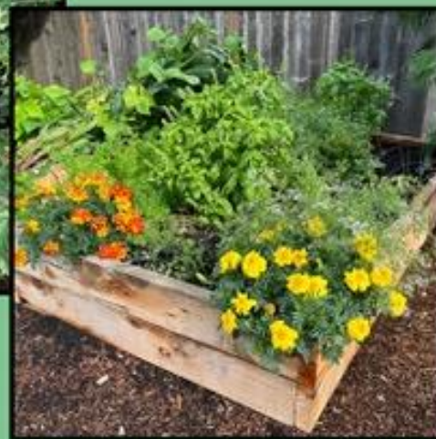
Marigolds help keep the bugs away from the surrounding basil and cilantro. A row of carrots is doing well, too, along the far side of the box.