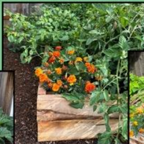
Orange marigolds glow before tomatoes and tomatillos on the right