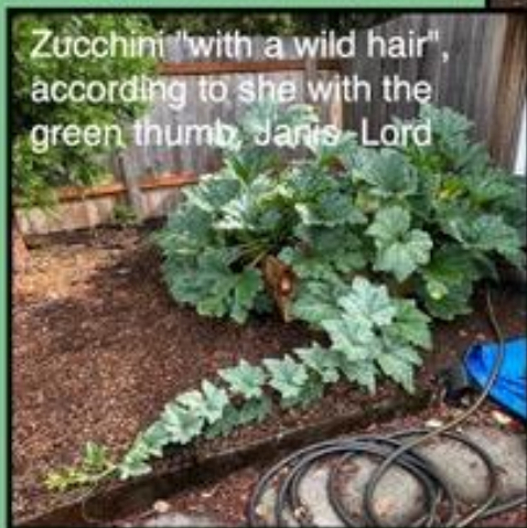
Zucchini "with a wild hair", according to she with the green thumb, Janis-Lord

St Lukes ~ San Lucas Your vegetable and flower gardens. Come out and pick 'em!